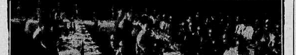
Um aspecto do almoço

Iniciando a sua campanha de expansao social, o Sindicato dos Lojistas realizou o seu primeiro almoço de confraternização do anno de 1936